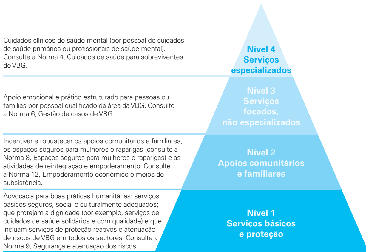
FIGURA 2. A Pirâmide de Intervenções do IASC para a saúde mental e o apoio psicossocial em emergências